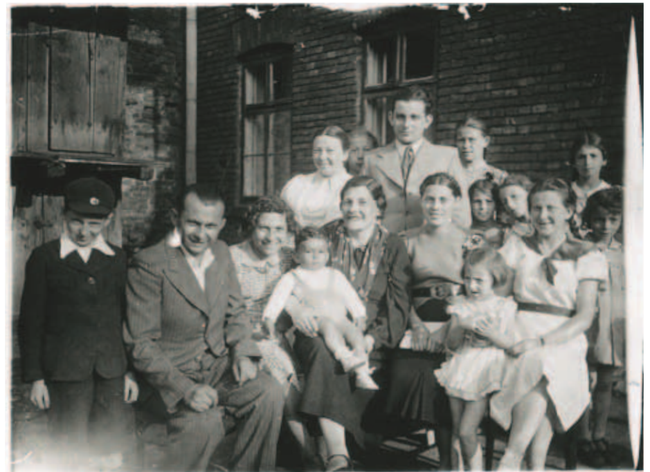
Erinnerungsfoto eines Auschwitz-Opfers. Familie Malach im Hinterhof eines Gebäudes, 1937.

Häftlingen bei der Einlieferung ins Lager selbst mitgebracht wurden und meist eigene frühere Aufnahmen, Verwandte oder Szenen aus ihrem ehemaligen Alltag, zeigen. Sie kamen im Zuge der Beschlagnahme ihrer Habseligkeiten in die Depots der KZ-Verwaltung, wo sie auch nach der Ermordung ihrer BesitzerInnen verblieben. Etwa 2.400 derartige Fotos sind im Archiv des Museums Auschwitz erhalten. 3