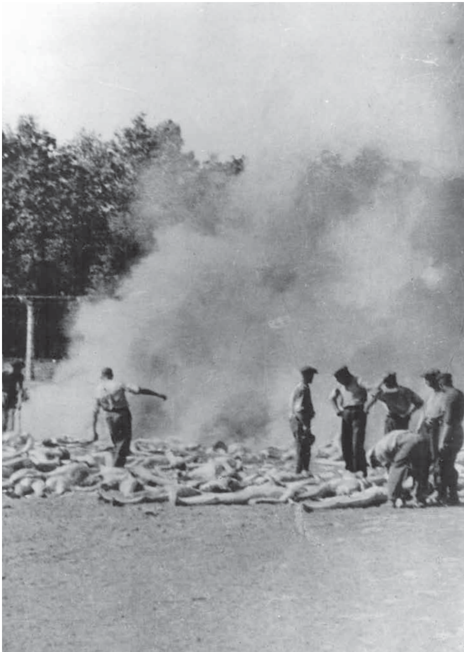
Leichenverbrennung durch Häftlinge in Birkenau (Ausschnitt).

Über deren Entstehung gibt es unterschiedliche Geschichten und Konflikte. Alter Fainzelberg (früher Fajnzylberg), ein Mitglied des Sonderkommandos, gab in einem Prozess an, eine Kamera aus dem Kommando „Kanada“ 12 von Eugeniusz David Szmulewski, einem Mitglied der polnischen Widerstandsbewegung, erhalten zu haben. Sie hätten die Fotos gemacht, und diese seien vom späteren polnischen Ministerpräsidenten Józef Cyrankewicz nach außen gebracht worden. 13 Im selben Prozess präzisierte Szmulewski, er selbst habe die Aufnahmen vom Dach des Krematoriums IV gemacht. 14 In einer anderen Aussage 15 gab Fainzelberg an, die Fotos der Leichenverbrennung habe ein anderer Häftling vor dem Krematorium V gemacht, ebenso gleichzeitig die Gruppe nackter Frauen im Wald. „Das Negativ“ habe er Szmulewski übergeben. In wieder einer anderen Aussage 16 gab er an, eine „fotografische Platte“ übergeben zu haben. Warum er einmal von einem Negativ und einmal von einer Glasplatte spricht und die Einzahl verwendet, wenn es doch mehrere Fotos waren, ist derzeit nicht erklärbar. Ein anderer Zeuge, Szymon Zajdow, behauptete, Szmulewski habe auf keinen Fall die Fotos machen, sondern bestenfalls beim Transport der Apparate oder der Filmrollen helfen können. 17