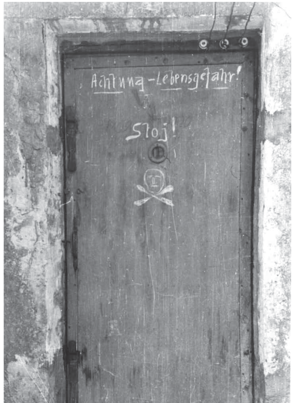
Türe vom Krematorium I. Die Aufnahme stammt aus der Zeit nach der Befreiung des Lagers, 1945.

Der letzte Komplex sind schließlich die Fotografien, die unmittelbar nach Auflösung des Lagers hergestellt wurden. Es ist dies eine Vielzahl von Aufnahmen, die von verschiedenen – meist Krakauer – Fotografen und internationalen Kommissionen gemacht wurden und sich nur teilweise in Abzügen im Archiv des Museums Auschwitz befinden. Sie zeigen den Zustand des Lagers nach der Sprengung der Krematorien Ende 1944 und der Befreiung im Jänner 1945. Gelegentlich sind auch einzelne Hinweise auf die Vernichtungen in Auschwitz-Birkenau zu finden.