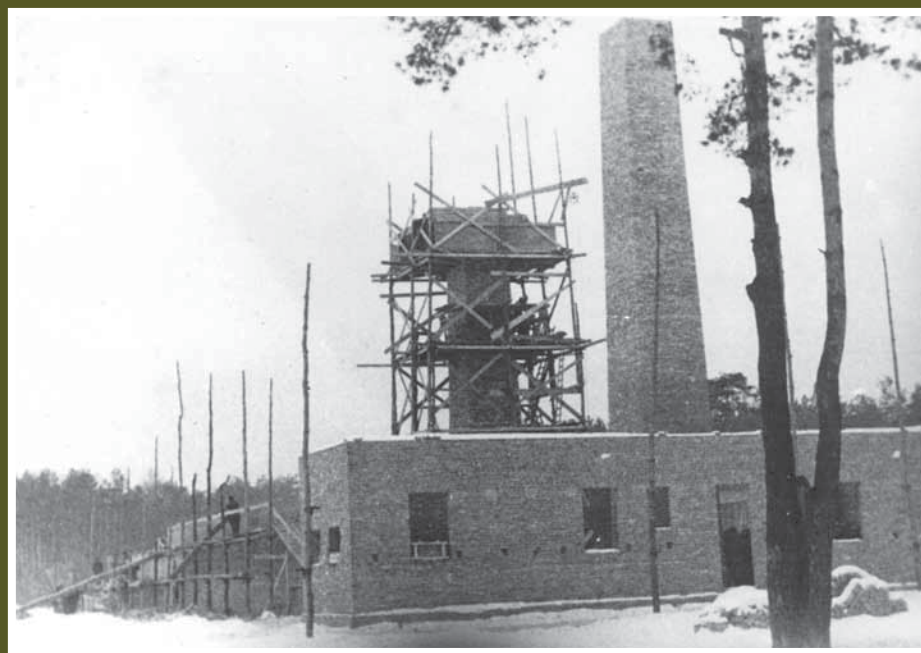
Bau des Krematoriums IV. Kopie aus einem Album der Zentralbauleitung.

Der Ausbau des Stammlagers Auschwitz I, des Vernichtungslagers Auschwitz II (Birkenau), der Fabrikanlagen in Auschwitz III (Buna/Monowitz) sowie einiger Nebenlager wurde von der Zentralbauleitung nach verschiedenen Objekten – darunter auch die Krematorien – und nach Baufortschritten fotografisch dokumentiert. Diese Fotografien finden sich verstreut in den Aktenbeständen der Zentralbauleitung Auschwitz im Tsentr khraneniia istoriko-dokumental'nykh kolleksi ( TsKhIDK ) in Moskau, Fotoalben der Zentralbauleitung verwahrt auch Yad Vashem.