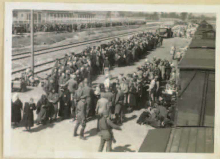
Aus dem Auschwitz-Album: Ankunft eines Transports an der Rampe in Birkenau, Mai 1944.