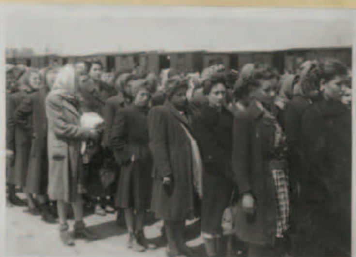
Aus dem Auschwitz-Album: Als Zwangsarbeiterinnen selektierte jüdische Frauen nach der Ankunft in Auschwitz, Mai 1944.