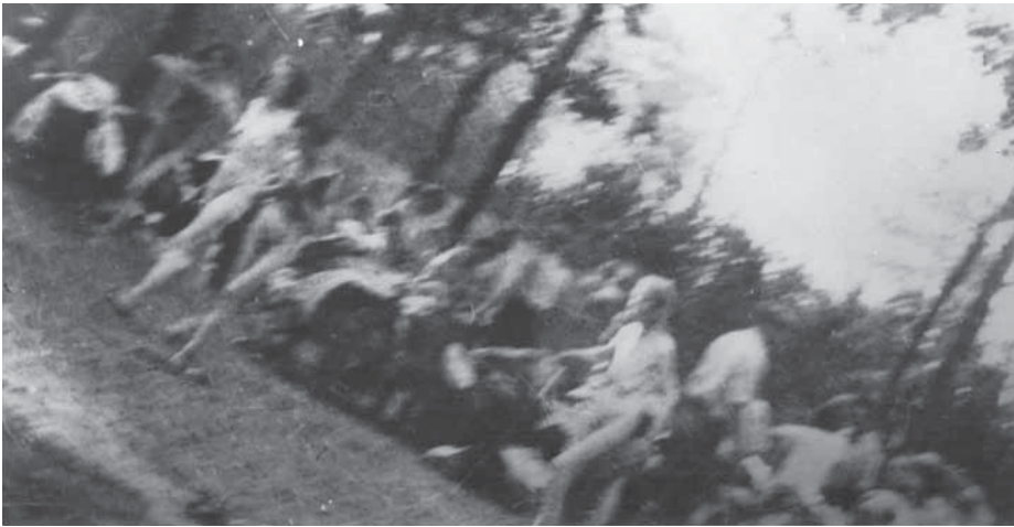
Unbekleidete Opfer auf dem Weg zu den Gaskammern im Wäldchen vor einem Krematorium (Ausschnitt).

Es gibt also eine ganze Reihe von Widersprüchen. Dass ein Fotoapparat aus dem „Kanada“-Kommando geschmuggelt wurde, ist einigermaßen glaubwürdig. Über die näheren Umstände der Aufnahmen lassen sich aus den Aussagen aber keine eindeutigen Fakten belegen. Dazu kommt noch, dass manche Zeuginnen und Zeugen in ihren Erklärungen übertrieben haben und Geschehnisse behaupteten, an denen sie selbst gar nicht beteiligt waren. Auch wurden in der kommunistischen Zeit oft aus politischen Gründen Personen ins Spiel gebracht, um eine Legitimation als Verfolgte zu haben (vermutlich auch das Beispiel von Cyrankewicz). Aus den Fotos ist zu erkennen, dass die Aufnahmen der Leichenverbrennung nicht vom Dach eines Krematoriums, sondern vom Boden aus gemacht wurden. Auch stehen die beiden unterschiedlichen Motive in keinem Zusammenhang, so dass anzunehmen ist, dass die Fotos der Leichenverbrennung und die der Frauen im Wald zu verschiedenen Zeiten entstanden sind.