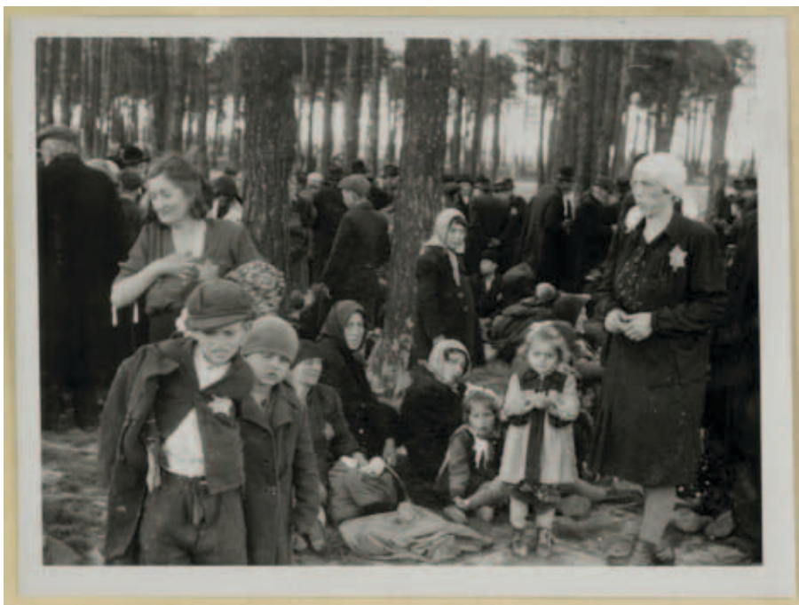
Aus dem Auschwitz-Album: Jüdische Opfer vor einem Krematorium vor der Ermordung, Mai 1944.

Insgesamt umfassen die illegalen Fotos fünf verschiedene Motive. Zwei der Fotos zeigen eine Leichenverbrennung auf einer Wiese mit arbeitenden Häftlingen, allerdings einmal mit einem Rahmen, der erkennen lässt, dass die Aufnahme von einem Schuppen heraus gemacht wurde, einmal einen Ausschnitt ohne diese Umrahmung. Zwei Fotos zeigen in einem Wald teilweise entkleidete Frauen, die in eine Richtung gehen, ein Bild zeigt nur Bäume und ist besonders unscharf. Die Bilder sind in verschiedenen Ausschnitten, Formaten und Qualitäten vorhanden, so dass es mitunter schwer ist, sie den fünf Ausgangsfotos zuzuordnen.