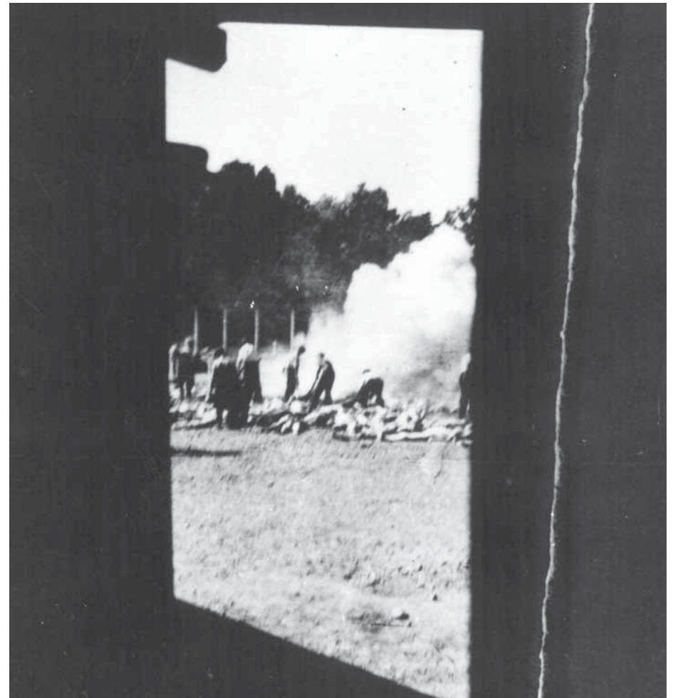
Leichenverbrennung durch Häftlinge in Birkenau. Aufnahme aus einem Schuppen.

Es gibt also eine ganze Reihe von Widersprüchen. Dass ein Fotoapparat aus dem „Kanada“-Kommando geschmuggelt wurde, ist einigermaßen glaubwürdig. Über die näheren Umstände der Aufnahmen lassen sich aus den Aussagen aber keine eindeutigen Fakten belegen. Dazu kommt noch, dass manche Zeuginnen und Zeugen in ihren Erklärungen übertrieben haben und Geschehnisse behaupteten, an denen sie selbst gar nicht beteiligt waren. Auch wurden in der kommunistischen Zeit oft aus politischen Gründen Personen ins Spiel gebracht, um eine Legitimation als Verfolgte zu haben (vermutlich auch das Beispiel von Cyrankewicz). Aus den Fotos ist zu erkennen, dass die Aufnahmen der Leichenverbrennung nicht vom Dach eines Krematoriums, sondern vom Boden aus gemacht wurden. Auch stehen die beiden unterschiedlichen Motive in keinem Zusammenhang, so dass anzunehmen ist, dass die Fotos der Leichenverbrennung und die der Frauen im Wald zu verschiedenen Zeiten entstanden sind.